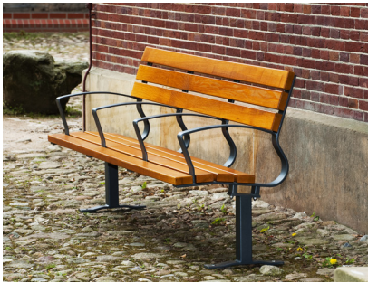
Artikel-Nr. 20 05 15

Die in diesem Prospekt abgebildeten Objekte sind in „Esche lasiert“.