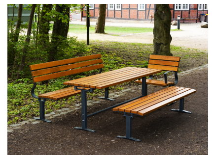
Artikel-Nr. 20 05 60, TISCH