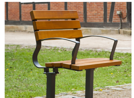
Artikel-Nr. 20 05 83