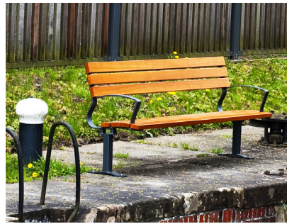
Artikel-Nr. 20 05 13