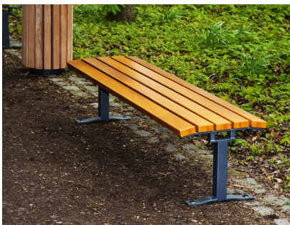
Artikel-Nr. 20 05 30