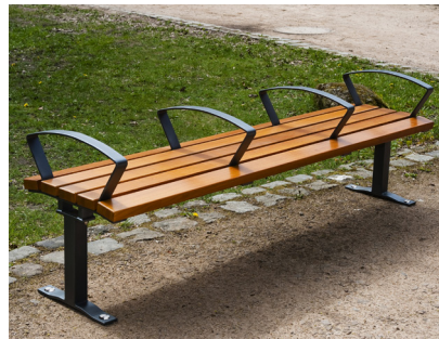
Artikel-Nr. 20 05 25