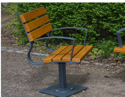
Artikel-Nr. 20 05 95