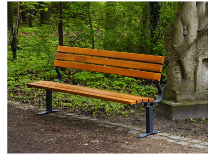
Artikel-Nr. 20 05 10